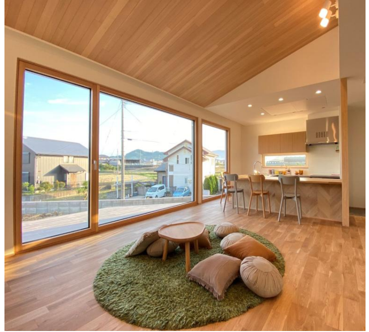
※写真は網戸無し仕様です。