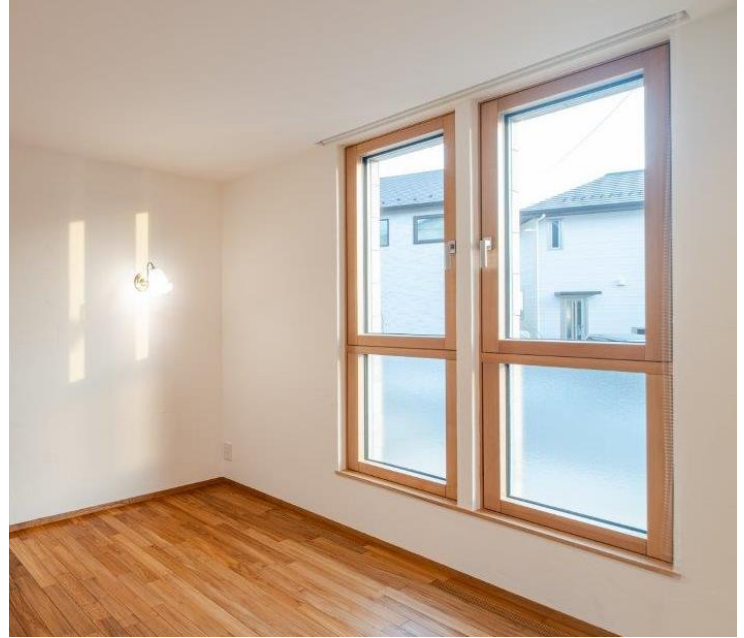
※写真は網戸無し仕様です。