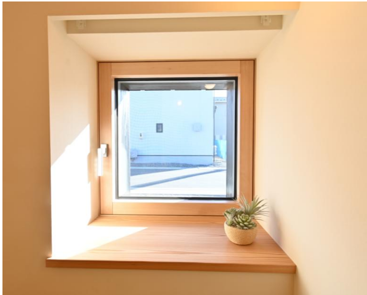
Drehkipp窓/ドレーキップ窓