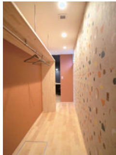
ウォークインクローク

白色をベースに×木のぬくもりを感じられるようなキッチンです。吊戸棚は見せる収納を。北欧デザインの食器にはiittala、マリメッコなど飾りたくなるようなものがたくさんあるので、見せる収納でOK!